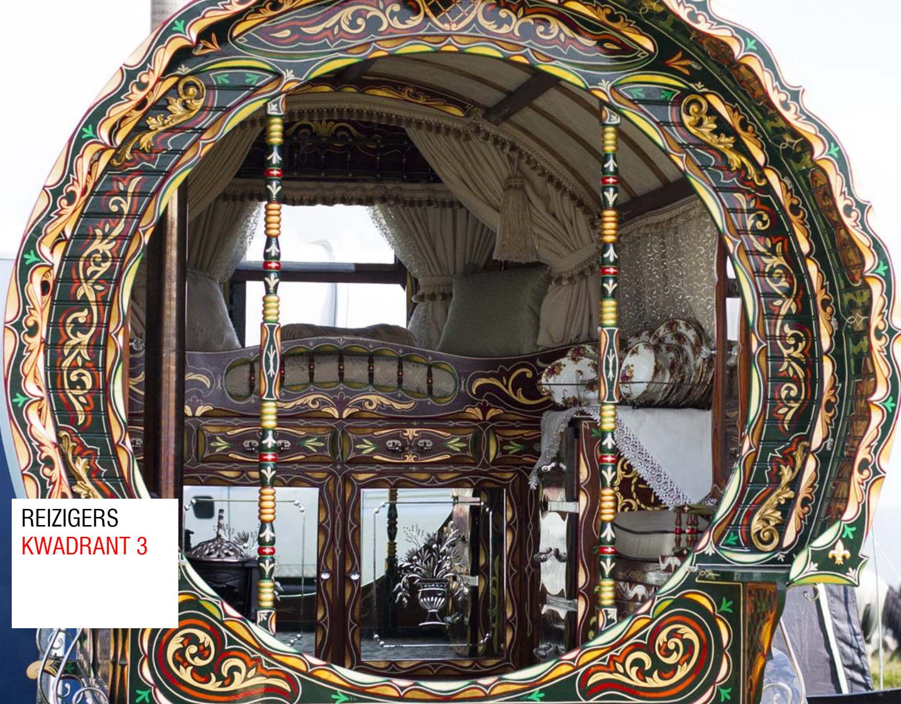
REIZIGERS KWADRANT 3